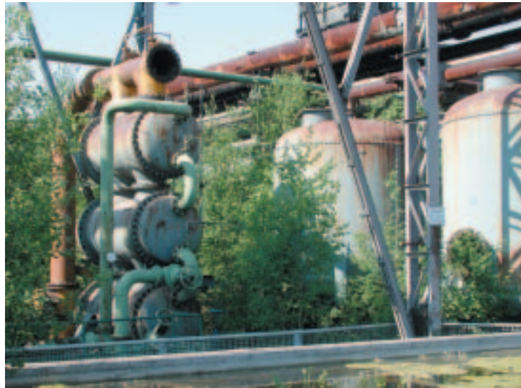
Kokerei Hansa (Dortmund): Vom Industriestandort zum Abfall, vom Abfall zum Kunstwerk

Alle drei Aspekte – Voraussetzungen, Instrumente und Kultur der räumlichen Planung – fasst der Begriff „Möglichkeitsmanagement“ zusammen. Das Ziel von Möglichkeitsmanagement (Frontier Management) ist die planerische Gestaltung und Nutzung von Grenzen.